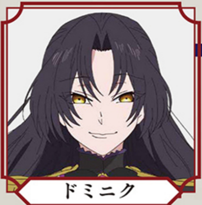
ドミニク CV:茅野愛衣