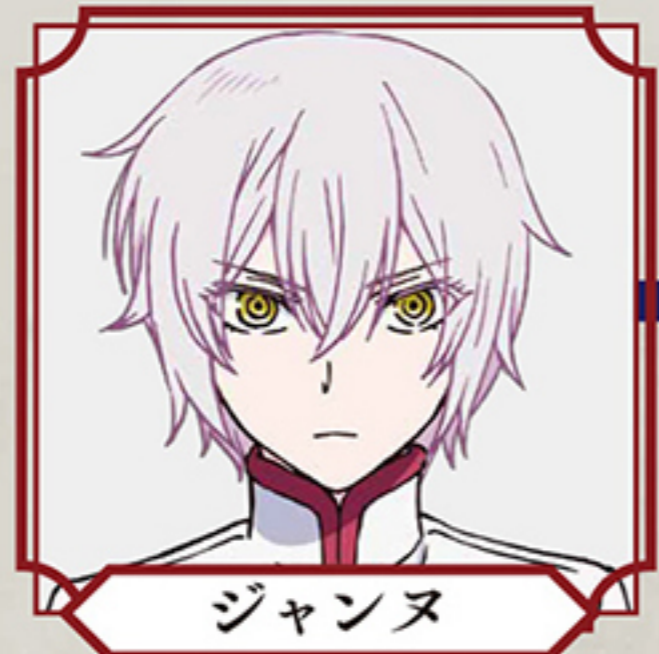
ジャンヌ CV:水瀬いのり